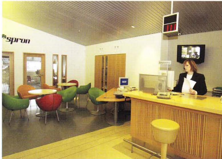
Útibú Spron Spönginni - Öformleg setgrúpa þjónustufulltrúa og viðskiptavinarins.

Öll formlegheit eru að hverfa, setstellingar sem þóttu dónalegar fyrir nokkrum árum þykja skynsamlegar núna, sittu öfugur, sittu á stólarminum, settu lappirnar upp á borð, já, fáðu þér jafnvel rólu á skrifstofuna. Væri ekki huggulegt að sitja á litlum vinnufundi í rólu og róla sér fram og aftur eins og í gamla daga. Þegar fundir eru boðaðir verður sagt: viltu vera með eða komdu á rólu. ■