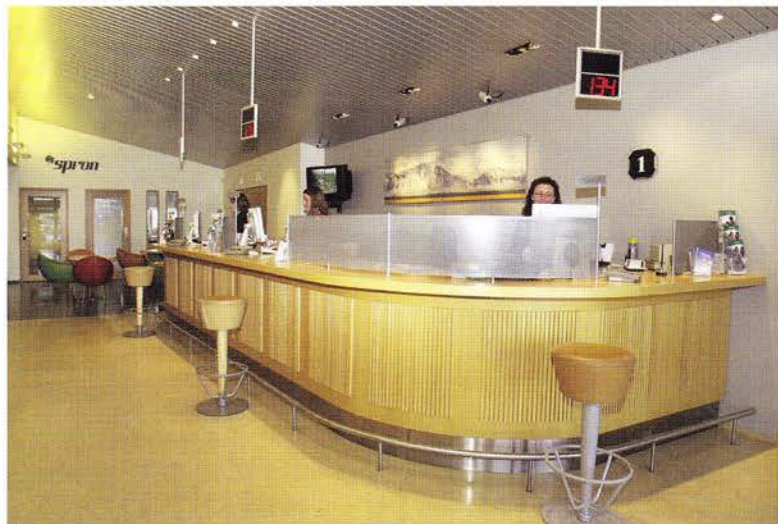
Útibú Spron Spönginni - Barinn undirstrikar afslöppuð viðskipti.