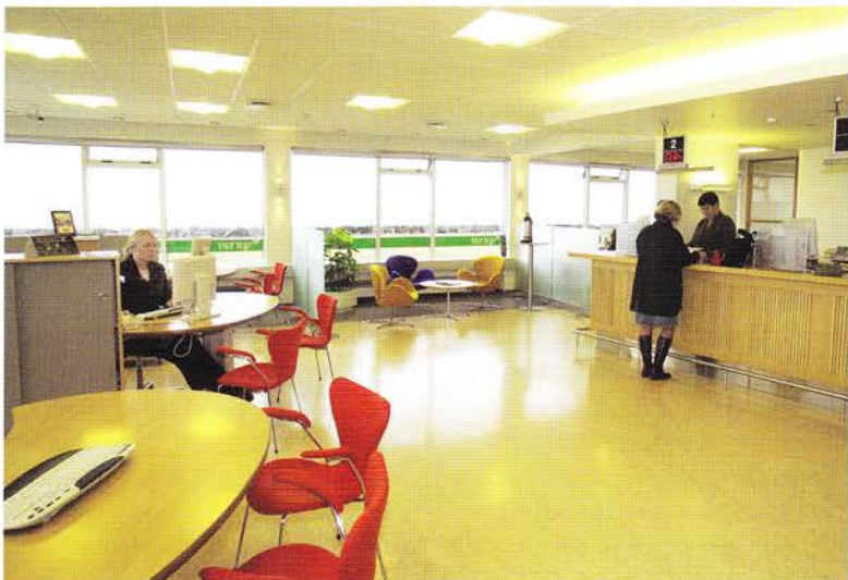
Útibú Spron Austurströnd - Þjónustufulltrúar sitja í framlínu. Húsgögn eru valin með breytileika að leiðarljósi, starfsmaður getur valið um að standa eða sitja við vinnu sína. Spron in Austurströnd - Employees forwards face front. Furniture chosen to be either sit or stand.